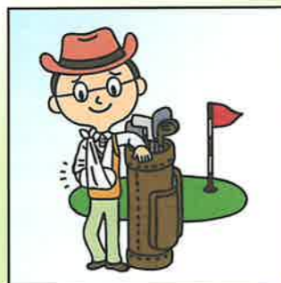
ゴルフ中にスイングした拍子に 転んでケガをした。