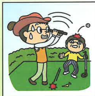
ゴルフ中に同伴者にケガを させてしまった。