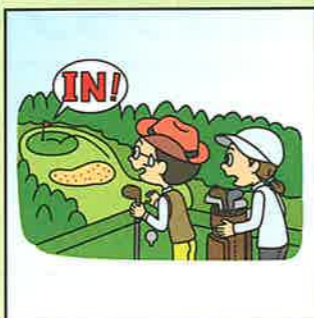
ホールインワンを達成して 祝賀会等の費用を負担した。