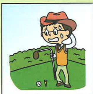
ゴルフクラブが曲損してしまった。