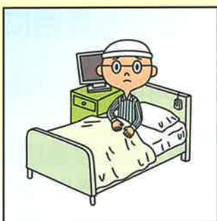
白血病と診断されてしまった。