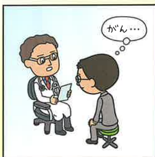
がんと診断されてしまった。