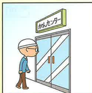
上皮内新生物が見つかった。