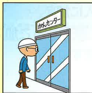
上皮内新生物が見つかった。