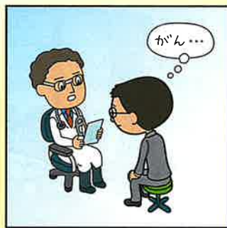
がんと診断されてしまった。