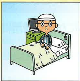
白血病と診断されてしまった。