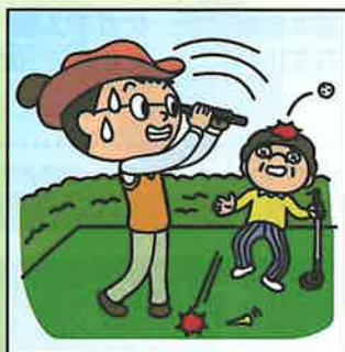
ゴルフ中に同伴者にケガを させてしまった。