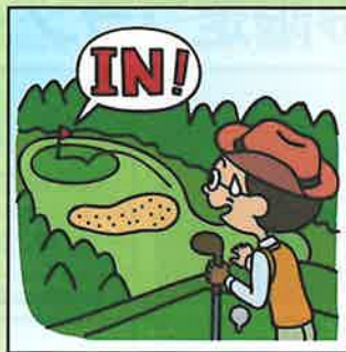
ホールインワンを達成して 祝賀会等の費用を負担した。