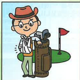
ゴルフ中にスイングした拍子に 転んでケガをした。