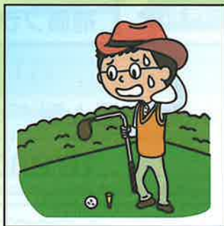
ゴルフクラブが曲損してしまった。